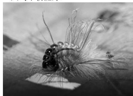
図7) リンゴコブガ 幼虫.