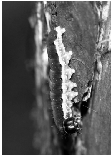
図 5) ホシボシトガリバ 幼虫.

ニッコウトガリバ Epipsestis nikkoensis (Matsumura)