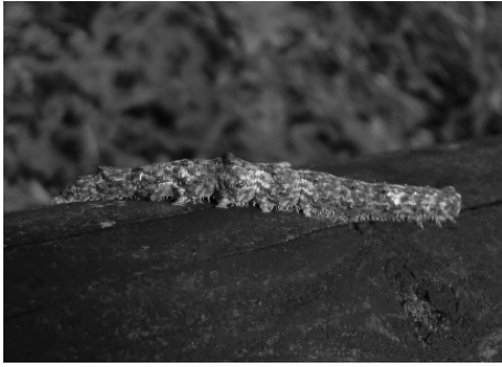
図 12) フシキキシタバ 幼虫 (野澤撮影).

フタトガリアオイガ Xanthodes transversa Guenée [麻生区] 1 ex., 早野, 6-VIII-2011, 山本 晃. 川崎市初記録.