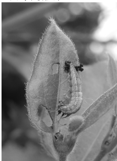
図 1) スイカズラクチブサガ 幼虫.