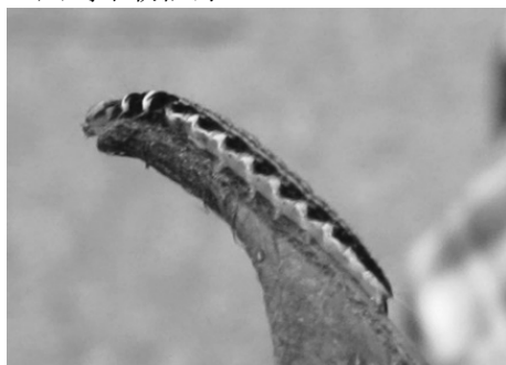
図 3) フジフサキバガ 幼虫.

フジフサキバガ Dichomeris oceanis Meyrick [多摩区] 1 ex., (幼虫撮影, 図 3), 柘形 (生田緑 地), 14-V-2015, 宮内隆夫. 川崎市初記録.