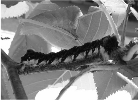
図 8) キバラケンモン 幼虫.