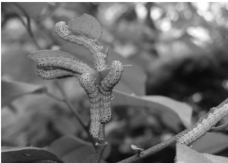
図 9) カギモンキリガ 幼虫.

川崎市初記録. 生田緑地は本種の多産地として一部に知られていたが, 公表された記録はない. 著者らによる調査では採集されておらず, 最近の発生状況は不明である.