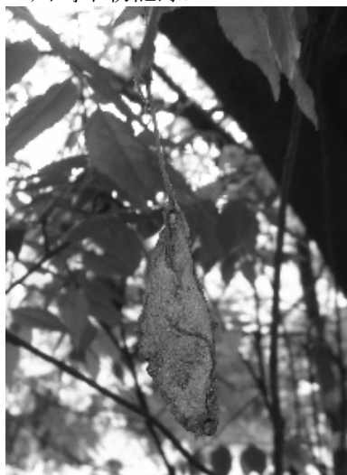
図 6) シンジュサン 繭.

シンジュサン Samia cynthia pryeri (Butler) [麻生区] 1 ex. (繭撮影, 図 6), 黒川, 1-V-2009, 横田光邦. 川崎市初記録.