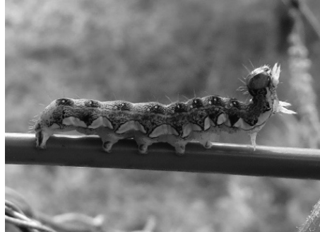
図 10) シラオビキリガ 幼虫.

スモモキリガ Perigrappa munda (Denis & Schiffermüller)