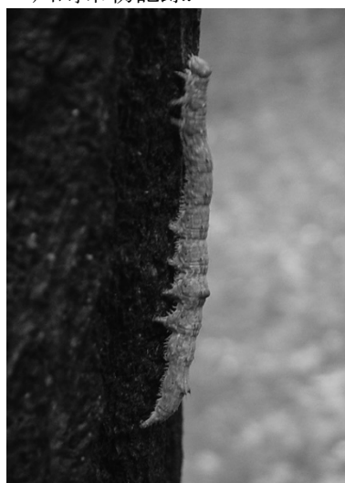
図 11) オニベニシタバ 幼虫.

コシロシタバ Catocala actaea Felder & Rogenhofer